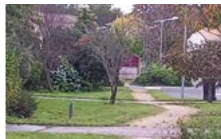
La directrice et les enseignantes