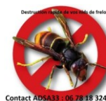
Contact ADSA33 : 06 78 18 324

L'important est d'utiliser un appât "sélectif" autant que possible et de piéger dans une période "sélective". Le piégeage doit arrêter en début du mois de mai.